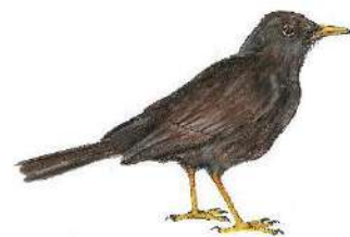
Zorzal chiguanco o Zorzal negro